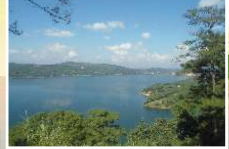
परिसर अभ्यास सहली