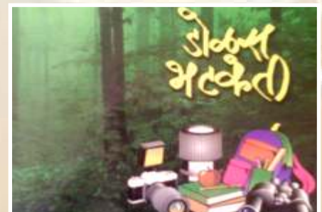
सहलीसाठी उपयुक्त पुस्तके