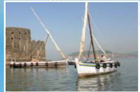
कोकणातील अभ्यास सहल