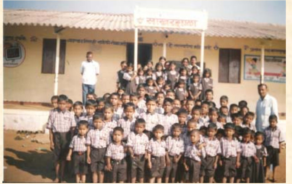
छ.शाहू सह.साखर कारखाना . ता.कागल. जि. कोल्हापूर .