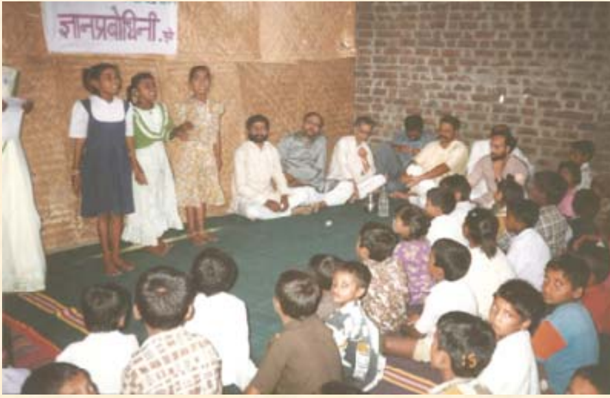
ज्ञान प्रबोधिनी मध्यवर्ती सहविचार समिती ची थेऊर येथील साखरशाळा भेट