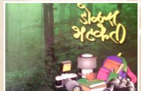
सहलीसाठी उपयुक्त पुस्तके