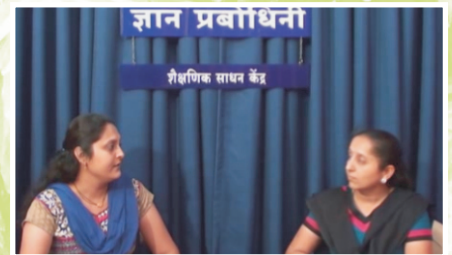
Food for brain development