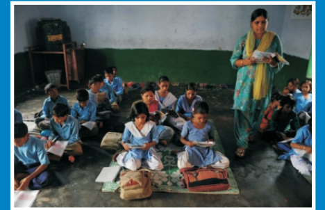
माझा शिक्षण विचार