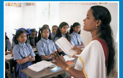
Teaching Philosophy Statement